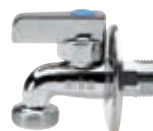
Art. S.0121 BIBO-PLUS