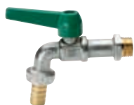
Art. S.0069 EKO-ARTIC