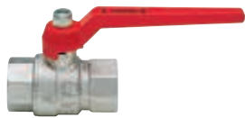
Art. S.0204 TOPIC