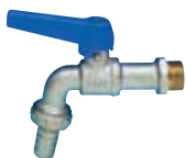
Art. S.0082 EKO