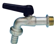
Art. S.0059 KIT