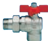
Art. S.0228 BASIC