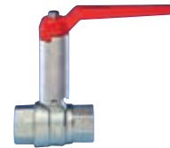
Art. S.0454 LOGIC