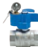
Art. S.1361 BASIC