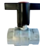
Art. S.3311 BASIC